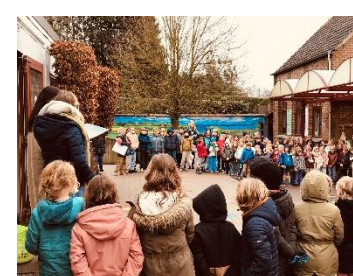
Sneeuwpret op de speelplaats